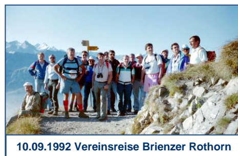
10.09.1992 Vereinsreise Brienzer Rothorn