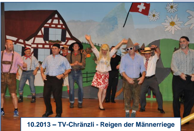
10.2013 – TV-Chränzli - Reigen der Männerriege