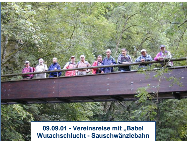
09.09.01 - Vereinsreise mit „Babel Wutachschlucht - Sauschwänzlebahn