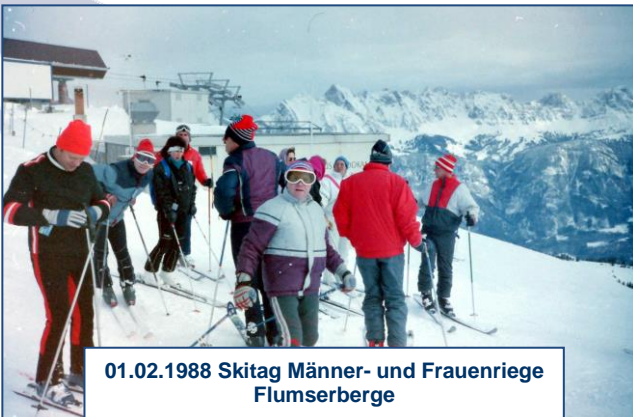
01.02.1988 Skitag Männer- und Frauenriege Flumserberge