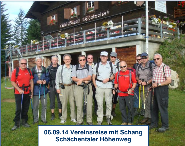
06.09.14 Vereinsreise mit Schang Schächentaler Höhenweg