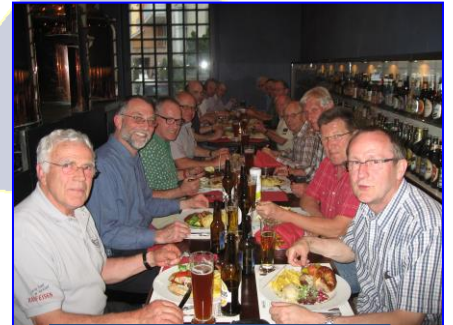
05.05.2013 Frühjahrsausflug Brauhaus Sternen Frauenfeld